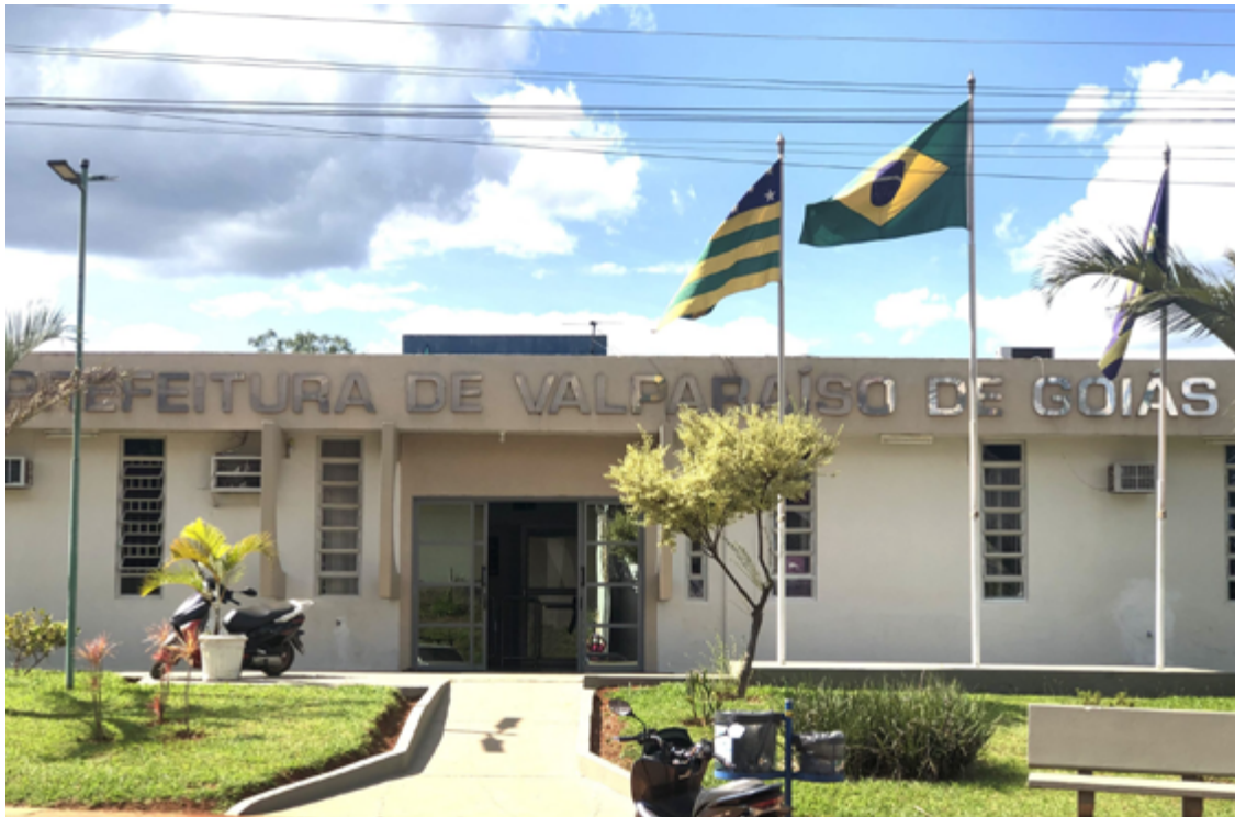
Além disso, Mossoró está sendo investigado pelo Tribunal de Contas da União (TCU) e pelo Ministério Público de Goiás (MP-GO) por suspeita de superfaturamento nas obras.

Conforme o documento da Comarca de Valparaíso de Goiás, assinado eletronicamente pelo oficial de justiça Beatriz de Fátima Pereira Magalhães, Mossoró foi oficialmente intimado