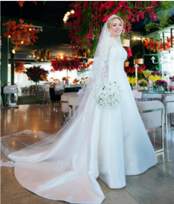
A noiva usou um deslumbrante vestido da marca espanhola Pronovias (Si Novias)