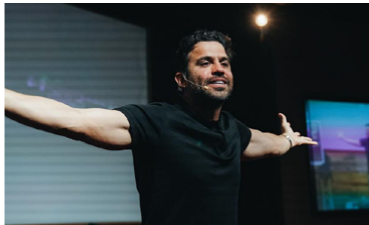
Pablo Marçal: influenciador, empresário e político