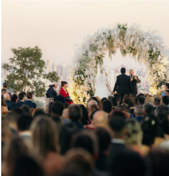
Ao fundo, vista da cidade de Goiânia na cerimônia realizada no Infinity Hall