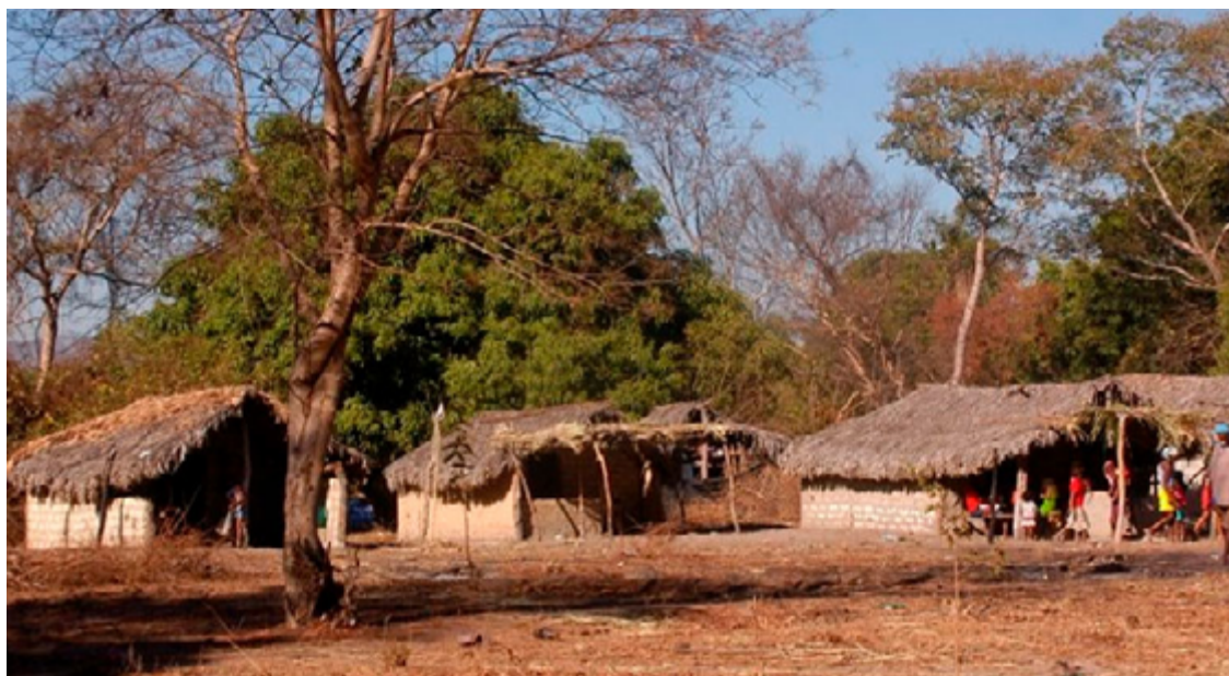
Hoje existem mais de 60 comunidades, sendo as seis principais: Contenda, Kalunga, Vão das Almas, Vão do Moleque, Ribeirão dos Bois e Engenho II, subdivididos em quase uma centena de agrupamentos

A pressão é definida como a medida do risco iminente de impacto ambiental em uma comunidade, resultante da implementação de obras de infraestrutura ou da sobreposição com registros, ou requerimentos mi-