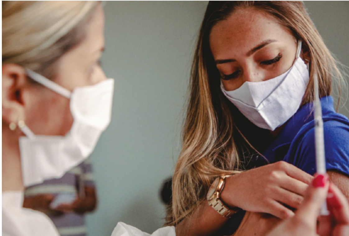
Entre os homens, 3,1 milhões declararam ter tomado pelo menos uma dose (90,2%) e, entre as mulheres, 3,2 milhões (93,0%)

em relação à instrução e quantidade de vacinados. Entre aqueles com ensino superior completo, 98,3% em Goiás tomaram ao menos uma dose. Enquanto o percentual de pessoas sem instrução e menos de um ano de estudo que chegaram a se vacinar é de 94,1% no estado.