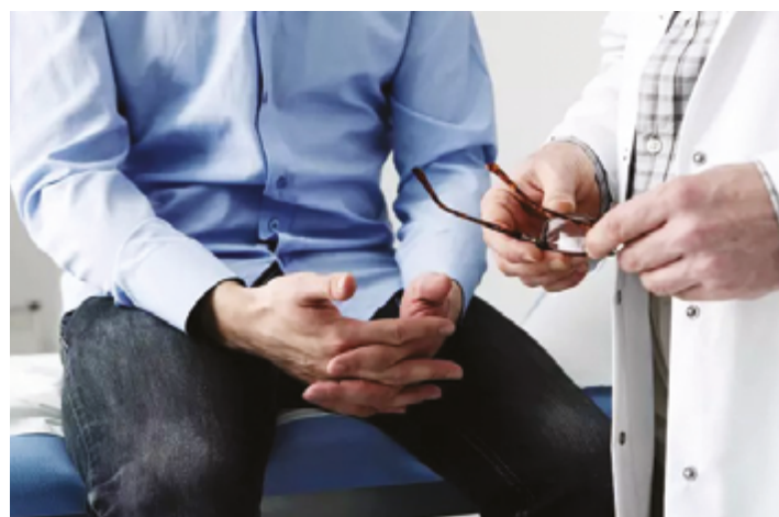
Especialista alerta sobre necessidade de consultas periódicas e de exames de endoscopia e colonoscopia a partir dos 45 anos

Em virtude dos problemas, o mês de maio também é dedicado à campanha de conscientização sobre doenças inflamatórias intestinais (DIIs), conhecida como Maio Roxo. As