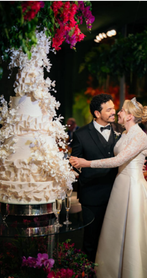
Mesa do bolo - Richesse Confeitaria