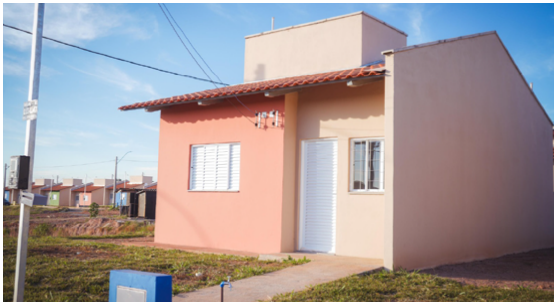
Moradia entregue pelo governador Ronaldo Caiado na segunda-feira para famílias vulneráveis

“Essas cidades menores, distantes de Goiânia, muitas vezes eram esquecidas e não recebiam programas sociais como este”, destacou Caiado. Somente neste mês, foram sorteadas unidades em Perolândia, Israelândia, Fazenda Nova, Montividiu, Santa Helena de Goiás, Porteirão, Abadiânia e Piracanjuba, entre outros.