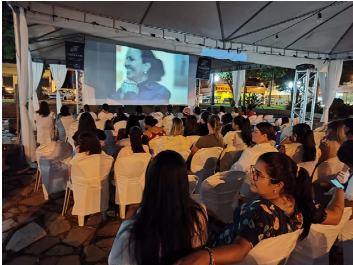
Cine Goiás Itinerante exibe filmes que participaram do Festival Internacional de Cinema e Vídeo Ambiental (Fica)

Além de estimular o interesse pela arte de animação cinematográfica e desenvolver capacidades criativas de trabalho em grupo, a atividade ainda conscientiza os jovens sobre a importância da reciclagem